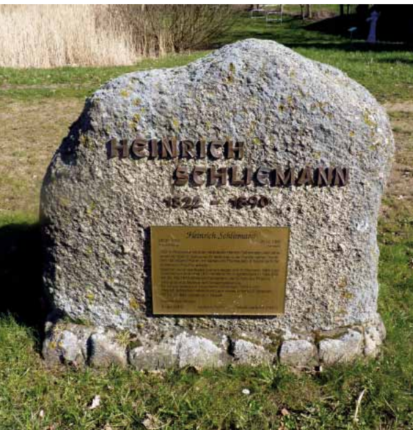
☒ Gedenkstein für den Troja-Entdecker Schliemann in Kalkhorst gegenüber der Kirche, in der sein Onkel als Pfarrer tätig war

Das Schloss ist aufgrund seiner Lage inmitten hoher Bäume des Schlossparks von Kalkhorst aus nicht zu sehen. Stattdessen dominiert die St.-Laurentius-Kirche den Ort visuell. Die mächtige dreischiffige Hallenkirche mit ihrem schiefergedeckten und weithin sichtbaren Turm steht an zentraler Stelle im Ort. Angeblich geht ihr Bau auf einen reichen Adligen zurück, der im 13. Jahrhundert zum Dank für seine Lebensrettung nach einem Schiffbruch auf der Ostsee schwor, eine Kirche zu errichten. Die Westwand der Kirche ist heute noch original erhalten. Die Kirche wurde wiederholt und letztmalig im 19. Jahrhundert umgebaut und verändert. Sie verfügt über eine ungewöhnlich reichhaltige Innenausstattung. Der prächtige und sehr beeindruckende Hochaltar mit der Darstellung der Auferstehung Jesu wurde 1708 vom Altarbauer Johann Friedrich Wilde aus Wismar errichtet. Seit 1653 besitzt die Kirche eine Orgel, die auf die Stiftung einer Lübecker Kaufmannsfamilie zurückzuführen ist. 1869 wurde die Orgel letztmalig umgebaut. Das alte Gehäuse mit Rankenschnitzwerk blieb erhalten und eine Inschrift erinnert an die Stifter. Die Kanzel im Mittelschiff der Kirche wurde 1714 im Barockstil erbaut.