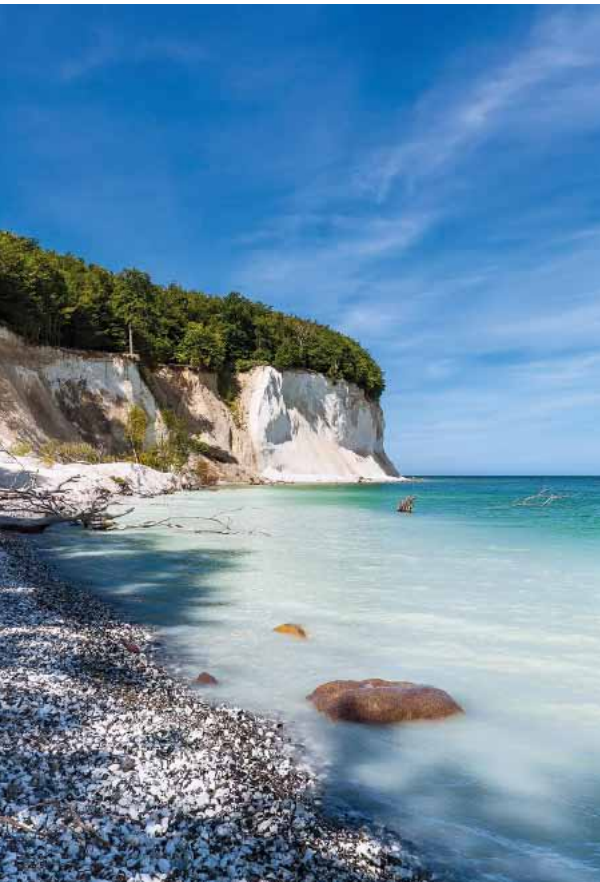
173we Abb.: fotoRico K., stockandite.com