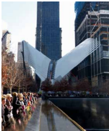
400my Abb.: mb

Dass New York niemals schläft, ist eine altbekannte Tatsache. Für Nachteulen bietet sich – abgesehen vom Broadway – das derzeit trendige East Village 25 zu einer Klub-/Bar-Tour an, z.B. in der Crif Dogs/PDT Bar (s.S. 238) oder im Death & Co (s.S. 238).