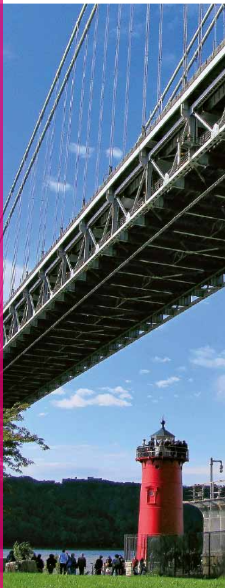
211ny Abb.: mb

Der beliebte Gourmet- und Flohmarkt Smorgasburg (s.S.254) hat sich an mehreren Standorten in Brooklyn etabliert. Neu sind mehrere Gourmet-Imbiss-hallen wie Hudson Eats (s.S.28) oder Urbanspace Vanderbilt (s.S.123). Bei den Turnstile Food Cart Tours (s.S.230) wird man satt und dazu gut informiert.