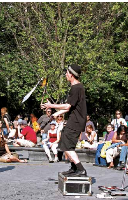
014my Abb.: mb

durch“ bieten sich die Imbisswagen am Straßenrand, die sogenannten pushcarts oder food trucks , an.