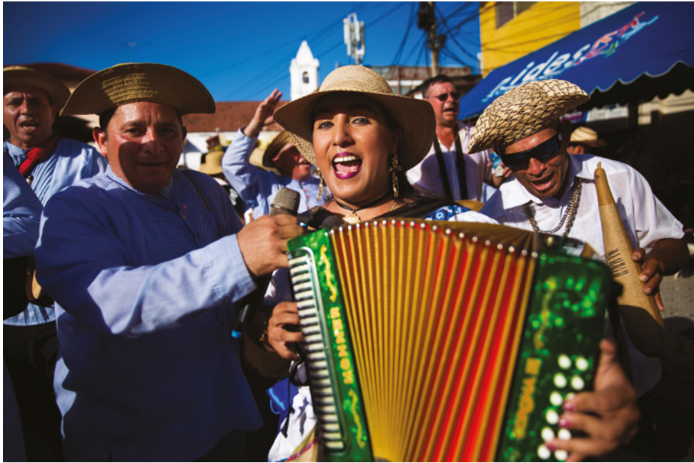
LAS TABLAS, PANAMA