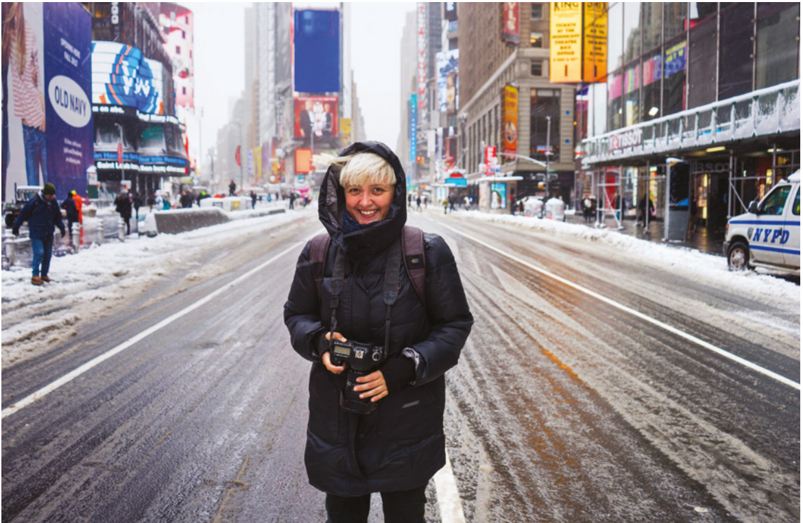
NEW YORK, USA

Ich hoffe, dieses Buch wird einer dieser Wege sein.