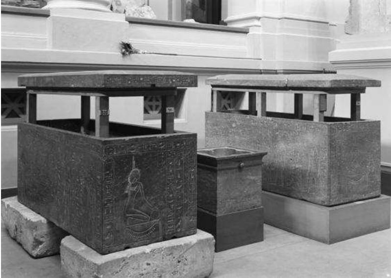
Abb. 1: Sarkophage von Hatschepsut und Thutmosis I. (Kat. 4-5 )